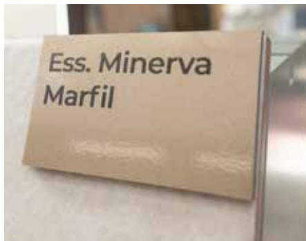
Vinilo bronce impreso sobre PVC negro