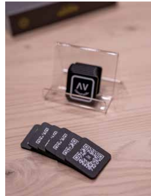
PVC negro impreso con tinta blanca