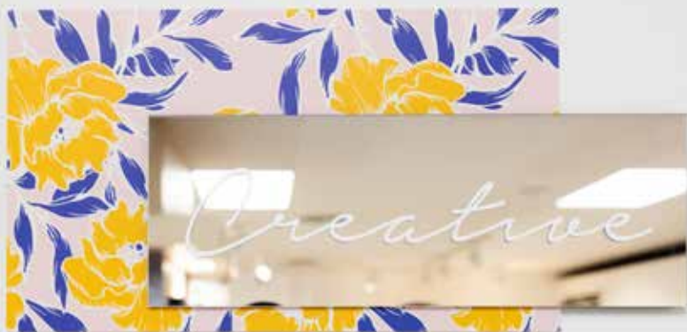
Metacrilato espejo con vinilo blanco sobre metacrilato impreso