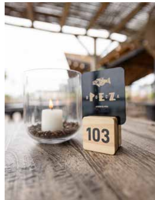
Metacrilato impreso sobre madera natural impresa