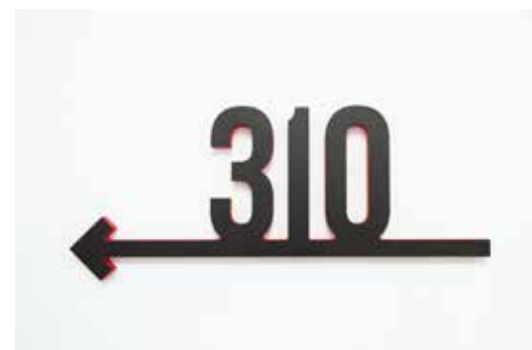
PVC rojo impreso en negro