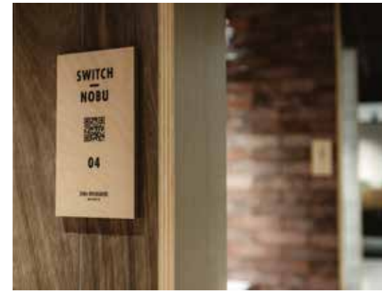
Madera natural impresa