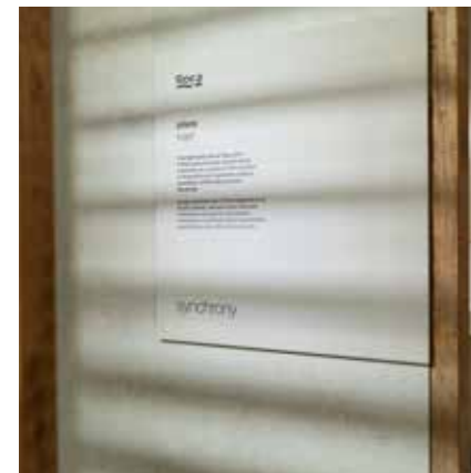
PVC blanco impreso