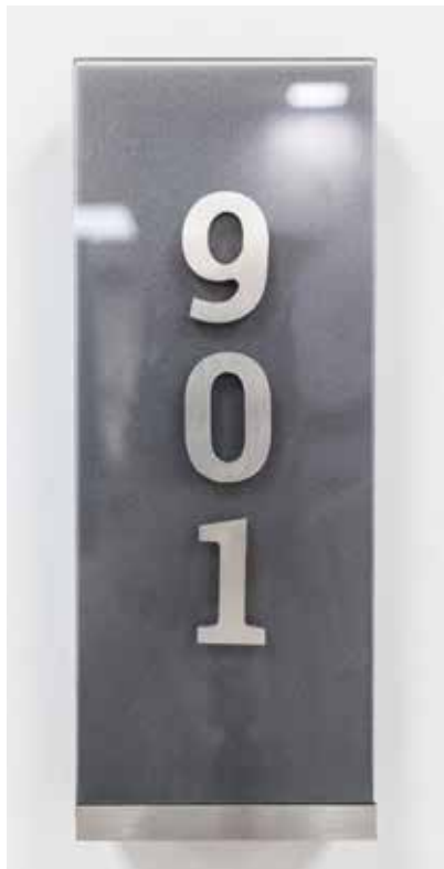
Metacrilato con vinilo gris perlado / Texto en dibond rayado