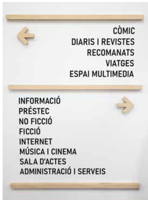
Madera natural / Vinilo de corte negro