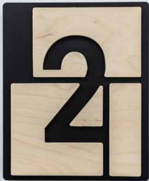
Madera natural sobre PVC negro rebajado