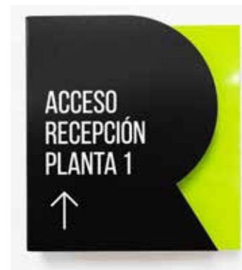
PVC negro impreso con tinta blanca sobre metacrilato verde