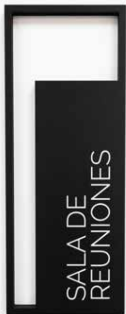
PVC negro vaciado impreso con tinta blanca

Atrévete, combina, juega, ¡dale carácter!