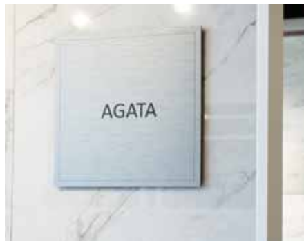
PVC negro con vinilo aluminio cepillado impreso