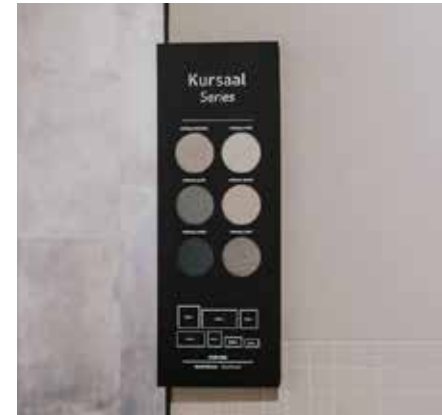
PVC negro impreso con tinta blanca