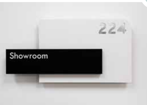
Metacrilato negro impreso con tinta blanca sobre metacrilato blanco troquelado