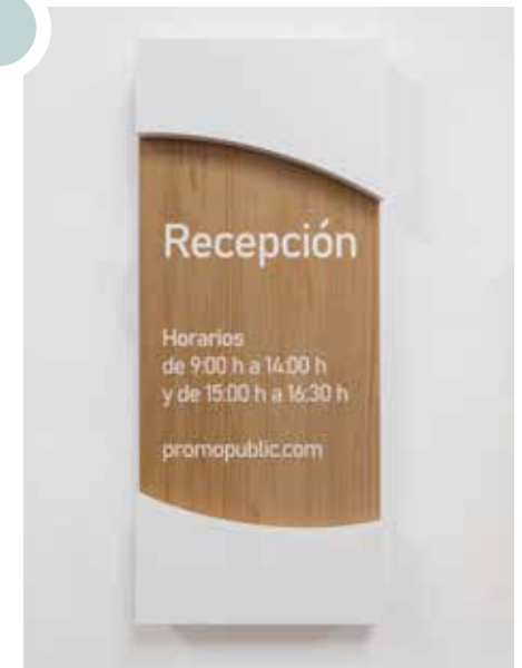
PVC blanco sobre vinilo efecto madera impreso con tinta blanca