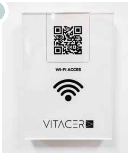
Metacrilato impreso con QR intercambiable