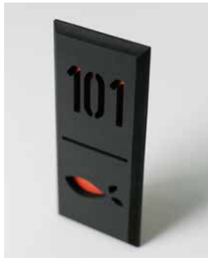
PVC negro vaciado impreso con tinta roja

Atrévete, combina, juega, ¡dale carácter!