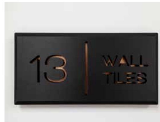
PVC negro vaciado con vinilo dorado

ALGUNOS DE NUESTROS PROYECTOS MÁS CREATIVOS, DISEÑADOS PARA INSPIRARTE