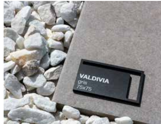
PVC negro vaciado impreso con tinta blanca