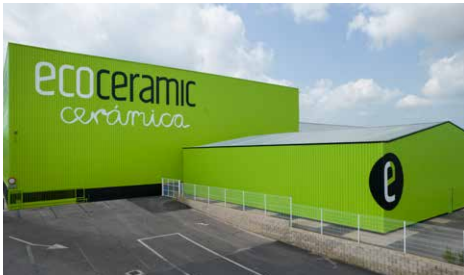
Restauración completa de fachada de más de xxm2.