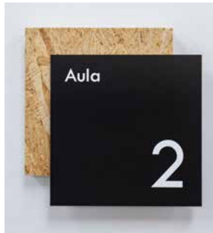
PVC negro impreso con tinta blanca sobre OSB