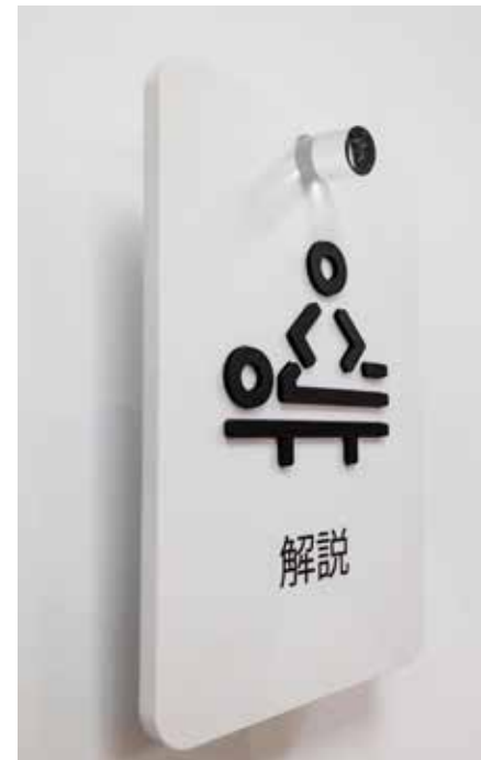
PVC negro sobre PVC blanco impreso / Perno de metacrilato