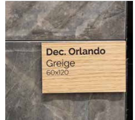
Vinilo efecto madera impreso sobre PVC