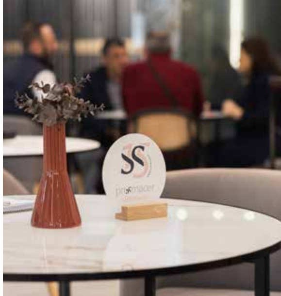
PVC blanco impreso sobre base de madera natural

Indicaciones claras y directas, garantizando una experiencia fluida.