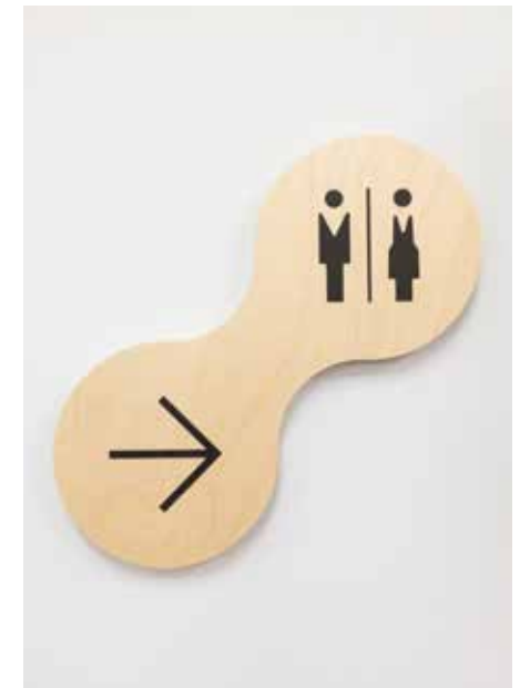
Madera natural impresa