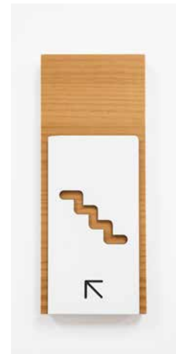
Dibond blanco vaciado e impreso sobre madera natural

ALGUNOS DE NUESTROS PROYECTOS MÁS CREATIVOS, DISEÑADOS PARA INSPIRARTE